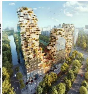
Valley, artist impression architect MVRDV

De Valley heeft veel weg van New Babylon: Gaat de Valley terug naar de dingen die al voorbijgegaan waren? Of was Constant Nieuwenhuis gewoon zijn tijd ver vooruit? En is New Babylon eigenlijk nog nooit geweest en daarmee ook nog niet voorbijgegaan.